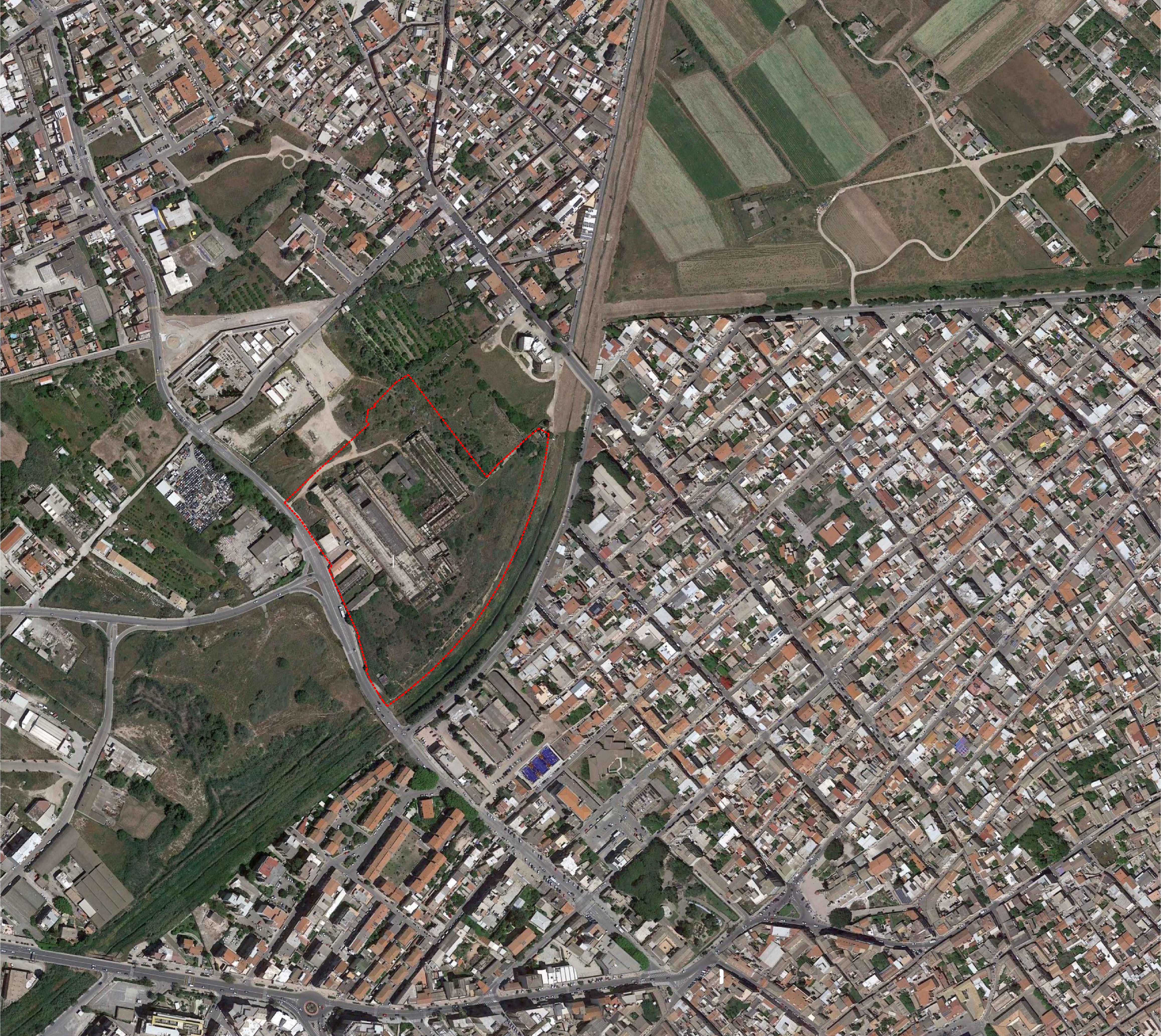
inquadramento fotopiano_scala 1:2000